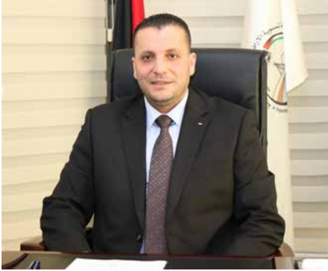
المصدر: هيئة تسوية الأراضي والمياه

السؤال: هناك عاملين شاملين يؤثران سلبيًا على أعمال تسوية الأراضي اليوم، ما هي خطط الطوارئ للتخفيف من أزمة كوفيد-19 وخطط الضم من قبل السلطات الإسرائيلية، بالإضافة إلى الاحتلال العسكري المستمر للضفة الغربية؟