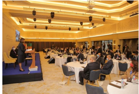
الشكل 3: السيدة/ إيلينا بانوفا، منسق الأمم المتحدة المقيم في مصر (برنامج الأمم المتحدة للمستوطنات البشرية (الموئل)، 2021)

هناك حاجة إلى مزيد من الجهود للتوزيع العادل للأراضي والموارد. يعد الامتداد الحضري والمستوطنات غير الرسمية مصدر معاناة العديد من الناس، وسيسمح التوسع الحضري الشامل بمعالجة ذلك من خلال تحسين البنية التحتية والنقل، وتحسين إدارة الأراضي لضمان الاستدامة، وضمان الضرائب. توفر الإيرادات موارد للحكومات المحلية. علاوة على ذلك، أثرت النزاعات في المنطقة سلباً على حقوق الإسكان والأرض والملكية لكثير من الناس.