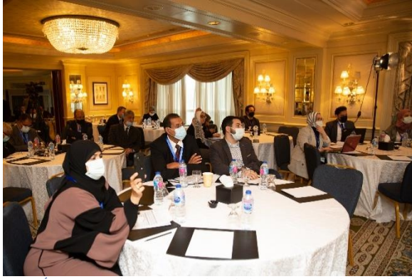
الشكل 14: المشاركون في الجلسة التقنية 5 ب حول استخدام الأراضي (برنامج الأمم المتحدة للمستوطنات البشرية، 2021).

المستوطنات البشرية على الأراضي المزروعة) ووقت السفر إلى الأسواق المحلية.