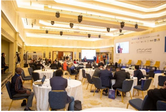
الشكل 17: الملاحظات الختامية التي أدلى بها الدكتور عرفان علي مدير المكتب الإقليمي للدول العربية، مؤنل الأمم المتحدة (مؤنل الأمم المتحدة، 2021).

الجهود التي تبذلها الدول للتصدي للأزمات الجديدة التي طال أمدها والمتصلة بالصراعات والتغير المناخي ووباء كوفيد-19.