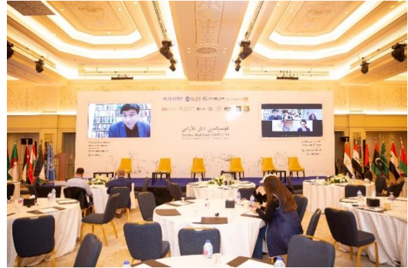
الشكل 15: البروفيسور سراج سايت، جامعة شرق لندن (UN-Habitat، 2021).

يرتبط الوصول إلى الأراضي واستخدامها والسيطرة عليها ارتباطاً وثيقاً بديناميات السلطة الأوسع والثروة والهوية الاجتماعية والثقافية وحتى البقاء على قيد الحياة. يمكن للمرأة في المنطقة العربية الوصول إلى الأراضي من خلال مجموعة واسعة من خيارات حيازة الأراضي المنتشرة على طول سلسلة متصلة من حقوق الأراضي وأكثر أو أقل أمناً، اعتماداً على ما إذا كانت رسمية ومسجلة أو محمية فقط من خلال الأعراف العرفية والاجتماعية. ومع ذلك، لا تزال النساء لا يستفدن بشكل كامل من هذه السلسلة المتصلة. بشأن صدى الجلسة الرفيعة المستوى حول المرأة والأراضي، سمحت هذه الجلسة للمشاركين بتقديم نظرة عامة عالمية على أمن حيازة المرأة في المنطقة العربية ومناقشة الضرورة الملحة لتمكين المرأة وتحسين حياتها من خلال حماية أراضيها ومسكنها وحقوق الملكية.