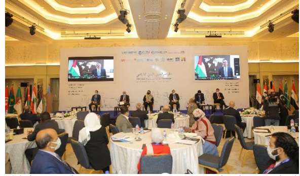
الشكل 4: معالي السيد/ محمد إبراهيم اشنتية، رئيس الوزراء، السلطة الوطنية الفلسطينية

هناك حاجة إلى مزيد من الاهتمام من حيث إدارة الأراضي لتسميات الوقف والدور الذي قد تلعبه في التنمية المستدامة. وبالمثل، فإن تعزيز حقوق المرأة في الأرض سيكون محورًا لتحقيق استقرار طويل الأمد.