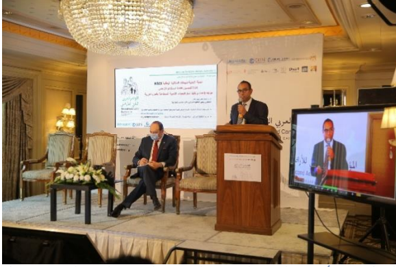
الشكل 10: أحمد حلمي، البيانات المكانية القومية البنية التحتية (موندل الأمم المتحدة، 2021).

المتحدثون: ديف ستاو، Ordnance Survey؛ نعيمة الحوسني، الإمارات العربية المتحدة؛ كارل شتايننتس، Harvard GSD؛ منال منديل، جامعة الإسكندرية