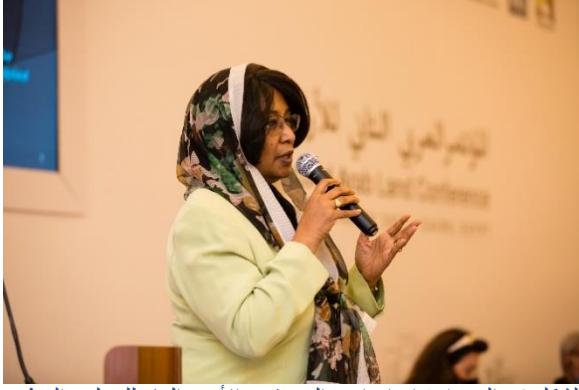
الشكل 6: السيدة/ فداء إبراهيم الدسوقي، الأمين العام للمجلس الوطني للتنمية الحضرية والتخطيط في السودان (برنامج الأمم المتحدة للمستوطنات البشرية (الموئل) (UN-Habitat)، 2021)