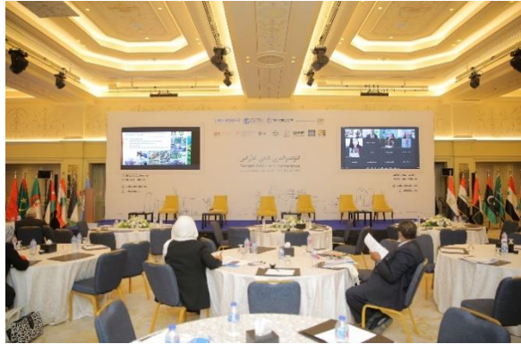
الشكل 8: المائدة المستديرة حول الإدارة الرشيدة للأراضي وحياد تدهور الأراضي (برنامج الأمم المتحدة للمستوطنات البشرية (الموئل) (UN-Habitat)، 2021).

إن اتفاقية الأمم المتحدة لمكافحة التصحر (UNCCD) ترى حيازة تدهور الأراضي من خلال نهج شمولي، وربط الأرض بمفهوم أوسع لأهداف التنمية المستدامة وتعزيزها الرفاه وسبل العيش والبيئة، والتي أصبح أكثر صلة بجائحة كورونا. الهدف هو تحقيق درجة الحيازة، حيث لا تكون موارد الأرض كذلك مفرط الاستغلال. أمن حيازة الأراضي هو مفتاح تمكين حيازة تدهور الأراضي لأن أولئك الذين يمتلكون الأرض قادرون وأكثر استعدادًا للاستثمار في استعادة الأرض. القرار المتخذ في مؤتمر نقوض الأطراف أمانة اتفاقية مكافحة التصحر بالعمل على ثلاث مسارات: السياسة وإعداد التقارير والتوعية. يلامس مسار السياسة بناءً على الدليل الفني حول كيفية الدمج المبادئ التوجيهية الطوعية للمسؤول حوكمة الحيازة في حيازة تدهور الأراضي.