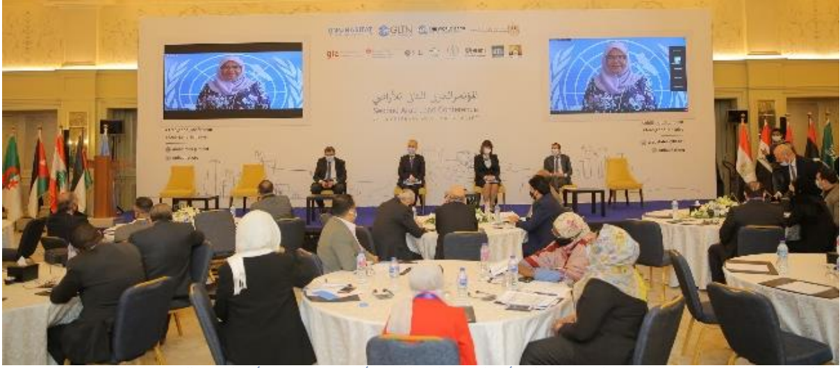
الشكل 1: ميمونة محمد شريف، المديرية التنفيذية لموئل الأمم المتحدة تلقي الكلمة الافتتاحية (برنامج الأمم المتحدة للمستوطنات البشرية، 2021).

من أجل النظر إلى الزوايا المختلفة لهذه القضايا؛ حيث جمع المؤتمر جمهورًا متنوعًا، بما في ذلك الأوساط الأكاديمية والسلطات الوطنية ووكالات التنمية الدولية والمجتمع المدني والمهنيون في مجال الأراضي، نظرًا لقيود جائحة كورونا، فقد عُقد المؤتمر كحدث هجين، مما سمح بالمشاركة الشخصية و عن طريق الإنترنت، وحضره أكثر من 800 شخص، 30 في المائة منهم كان حضوراً شخصياً.