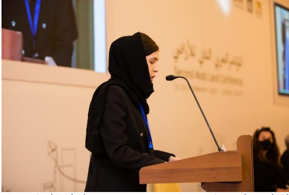
الشكل 2: السيدة/ شيلان عارف حمه-نائب وزير العدل بإقليم كردستان العراق، (برنامج الأمم المتحدة للمستوطنات البشرية (الموئل) (UN-Habitat)، 2021)

وتضمنت الجلسات الفنية مواضيع مثل التقنيات والحلول الذكية لإدارة الأراضي، ودور القطاع الخاص في إدارة الأراضي، والأدوات والممارسات للاستخدام الفعال للأراضي والتسجيل الفعال للأراضي والممتلكات، إلخ.. ووافق المشاركون على أن مساهمة كلاً من القطاع الخاص وكذلك مجتمع الأعمال في جميع مجالات التنمية يُعد أمر حاسم لتحقيق أهداف التنمية المستدامة.