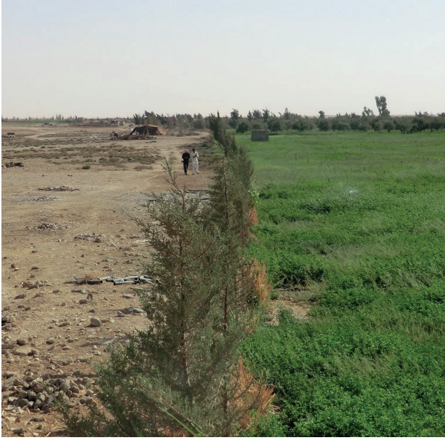
شكل ٢: كيف يساهم نقص الوصول إلى المياه في تدهور الأراضي الجافة: على اليسار، البرسيم المروي بالرش، على الأرض الجافة اليمنى في الأزرق، الأردن.