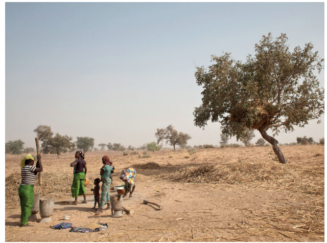
شكل ٣: نساء يطحن بذور الدخن في النيجر.

ينبغي إعطاء الأولوية لتوعية الأطراف المعنية الدولية والوطنية والمحلية وتنمية قدراتها بشأن التداخل بين حوكمة الأراضي، وأمن حيازة الأراضي، وتدهور الأراضي، والنزاعات واسعة النطاق، والنزوح. وينبغي تشجيع الأطراف